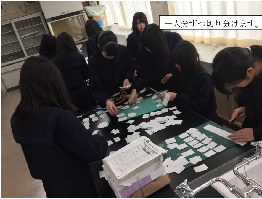
一人分ずつ切り分けます。