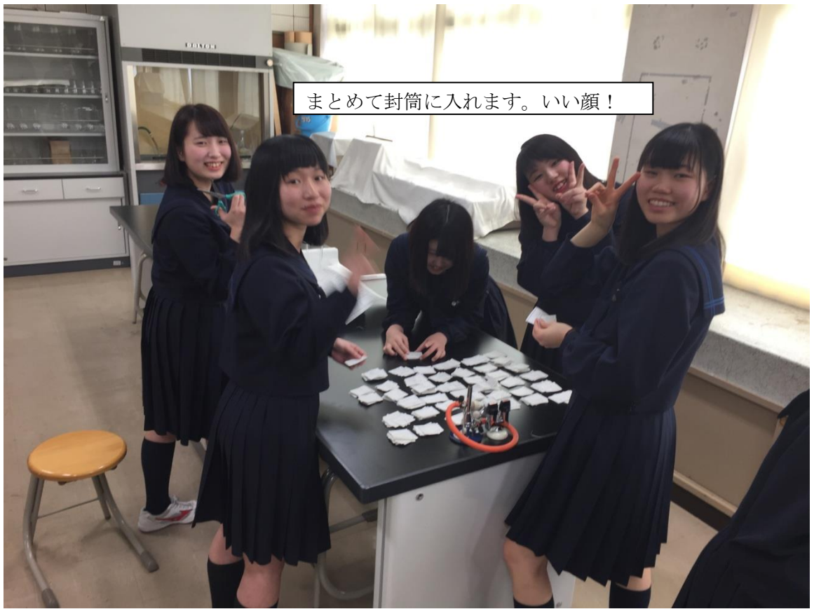
まとめて封筒に入れます。いい顔！